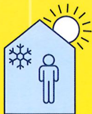
RESTEZ AU FRAIS