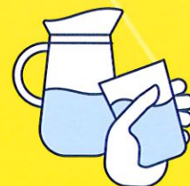
BUVEZ DE L'EAU